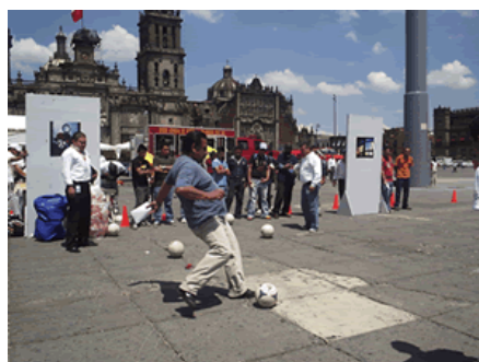
Una de las actividades que más público convocó fue el tiro libre para anotarle gol a la corrupción.