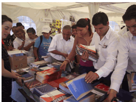
Fundar despertó el interés de los asistentes a la Feria de la Transparencia, quienes pudieron obtener varios de los títulos publicados.